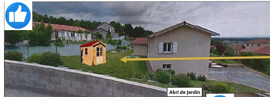
Abrî de jardin

Insertions paysagères de deux projets dans une même demande : un abri de jardin et une piscine