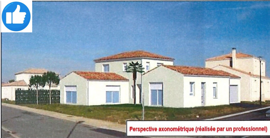
Perspective axonométrique (réalisée par un professionnel)