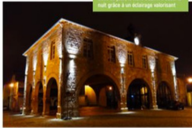
Belle de jour, la Halle s'admire aussi la nuit grâce à un éclairage valorisant