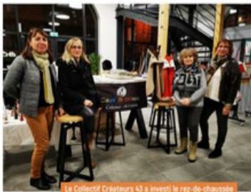
Le Collectif Créateurs 43 a investi le rez-de-chaussée pour une expo-vente au cœur du bourg médiéval