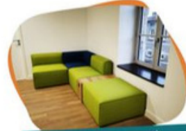
Située en face de l'escalier et de l'atelier, la mezzanine offre des fauteuils modernes pour tous les âges