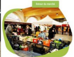
Retour du marché