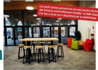
Les poufs colorés permettront aux plus jeunes d'écouter des histoires confortablement installés, la table dispose d'un bac à livres mis à disposition par la médiathèque