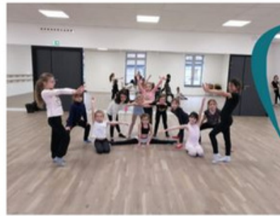
Cours de danse dans la grande salle