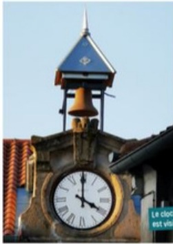
Le clocheton rénové est visible de loin

L'achèvement du chantier a été retardé par la crise sanitaire. Le marché est revenu sous la Halle comme cela avait été annoncé et les nouvelles salles ont finalement ouvert leurs portes au mois de novembre. Lieu culturel et associatif, elle accueille les cours de danse ainsi que la gym douce dans la grande salle du premier étage (environ 100 m 2 ). La deuxième salle de l'étage (environ 60 m 2 ) est consacrée aux expositions, aux ateliers d'art ou aux conférences. Le Printemps des Couleurs y sera accueilli au mois de mars 2022. Le rez-de-chaussée est meublé d'une table haute entourée de tabourets hauts de style industriel. Les enfants peuvent profiter des poufs colorés pour consulter des livres mis à disposition par la médiathèque. Le Collectif Créateurs 43 a utilisé ce lieu pour ses expositions-ventes au mois de décembre. Le téléviseur situé au rez-de-chaussée remplace le panneau lumineux et il offre aux Désidériens un nouveau support de communication municipale.